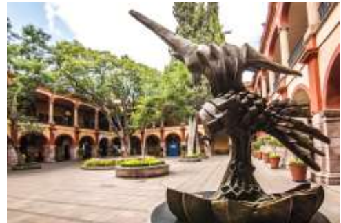
Escultura "Espíritu universitario" Patio edificio central Universidad Autónoma de San Luis Potosí, México